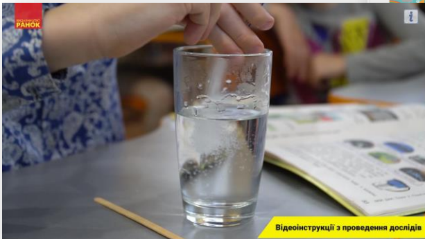
Відеоінструкції з проведення дослідів